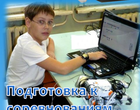
Подготовка к соревнованиям.

Призер Всероссийской роботехнической олимпиады 2015 – 2 место.